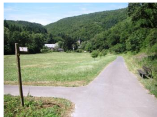
Kloster Maria Engelport