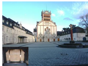
Trier, St. Matthias