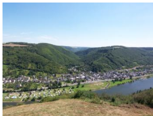
Lasserg, Blick auf Burgen