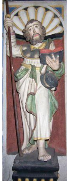
St. Jakobus (Stiftskirche St. Kastor, Karden)

Koblenz-Stolzenfels - Waldesch - Hünenfeld (Gem. Rhens) - Naßheck (Gem. Dieblich) - Dreifaltigkeitskirche Bleidenberg (Gem. Oberfell) - Alken - Löf - Hatzenport - Lasserg (Stadt Münstermaifeld) - Burg Eltz (Gem. Wierschem) - Karden - Treis - Kloster Maria Engelport - Beilstein - Kapelle Lindenhäuschen (Gem. Grenderich) - Bullay - Marienburg - Zell-Kaimt - Zell - Bummkopf (Gem. Briedel) - Enkirch - Starkenburg - Traben-Trarbach - Bernkastel-Kues - Lieser - (Osann-) Monzel - Klausen - Krames - Klüsserath - Ensch - Schweich - Trier-Quint - Trier-Ehrang - Trier-Biewer - Trier (St. Matthias)