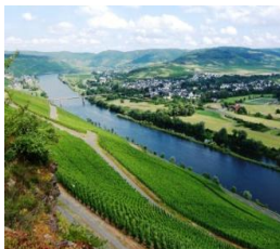
Lieser und Mülheim