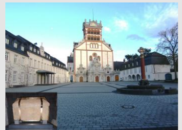
Trier St. Matthias