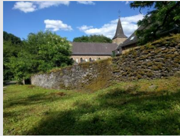
Kloster Maria Engelport