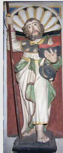
St. Jakobus (Stiftskirche St. Kastor, Karden)