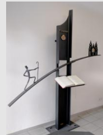
Pilger auf dem Weg nach SdC (Pilgerherberge Klausen)