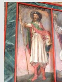
St. Jakobus (Ev. Kirche Starkenburg)