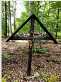
Grenderich > Bullay