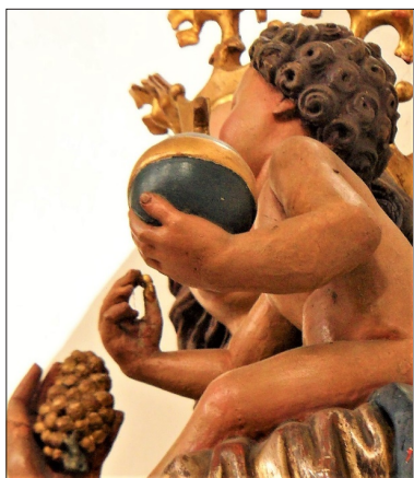
Fragment rzeźby Madonna mit der Traube Fot. Angelika Krawiec

uwagę zasługuje także półksiężyc wypełniony twarzą u stóp Maryi. Stanowi on aluzję do słów z Apokalipsy św. Jana: „Potem wielki znak się ukazał na niebie: Niewiasta obleczona w słońce i księżyc pod jej stopami, a na jej głowie wieniec z gwiazd dwunastu” (Ap 12, 1) 30 . Maria razem ze swoim boskim dzieckiem przywołuje tylko pozytywne skojarzenia. Księżyc, który depta ona stopami, występuje w tej rzeźbie jako znak nietrwałości i wszystkiego, co ziemskie, doczesne, przemijające.