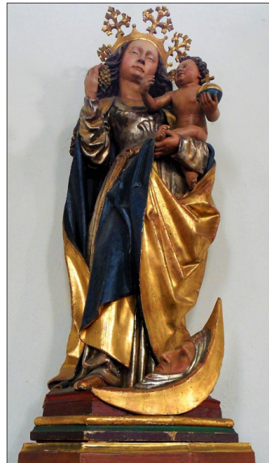
Madonna mit der Traube z barokowego kościoła świętego Laurencjusza, Longuich

W kompozycji rzeźby uwagę przykuwa również kula ziemską, którą trzyma Dzieciątko w lewej dłoni. Jest ona symbolem boskiej władzy, a wraz z krzyżem przypomina o zbawieniu świata dokonanym przez śmierć Chrystusa 29 . Ważna w rzeźbie jest także ugięta w stronę widza nóżka Dzieciątka – może ona wskazywać miejsce, w którym będzie wbity gwóźdź krzyżowy. Z kolei nagość małego Jezusa symbolizuje potrzebę opieki i ochrony oraz niewinność i wrażliwość, a także prawdę. Na