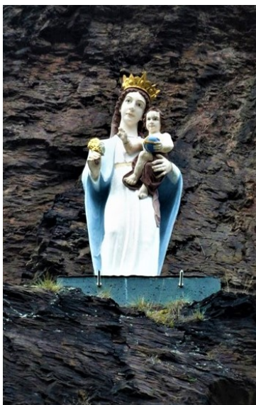
Madonnenstatue mit dem Kind in der Brauselay, Cochem