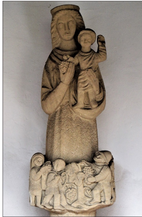
Madonna in den Reben, Kirscher Heiligenhäuschen, Longuich

W kontekście omawianej problematyki godnym uwagi jest znany na całym świecie XVI-wieczny obraz (powstały około 1540 r.) Madonny pędzla Lucasa Cranacha Starszego – znanego niemieckiego malarza i grafika z epoki renesansu zatytułowany Madonna mit Kind und Weintraube (pol. Madonna z Dzieckiem i winogronem ). Obraz zakupiony przez rodzinę Eltz-Rübenach znajduje się obecnie w ich dawnym pokoju dziennym w imponującym zamku Burg Eltz 31 niedaleko miejscowości Moselkern.