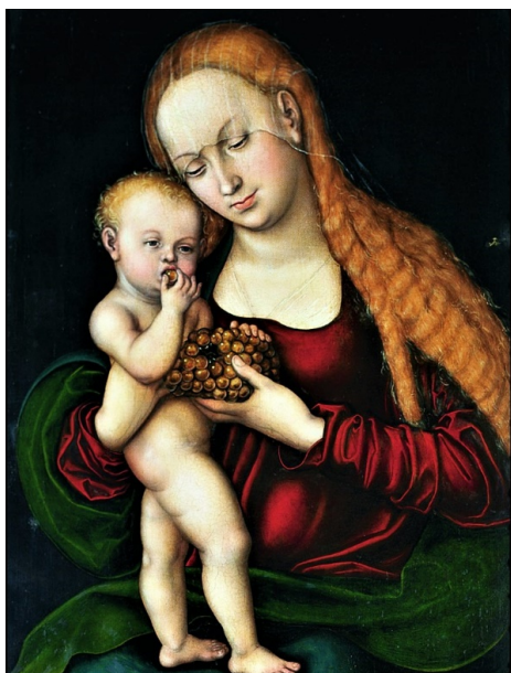
Madonna mit Kind und Weintraube , Lucas Cranach Starszy